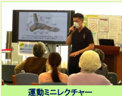
運動ミニレクチャー

今回のフットケアの日イベントを機に、地域の皆さんが自分の足を見つめ直し、定期的にケアしていただけるようになればと思います。