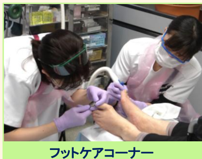
フットケアコーナー