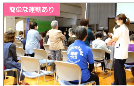
簡単な運動あり フレイルって何だろう？ ～介護予防の第一歩～