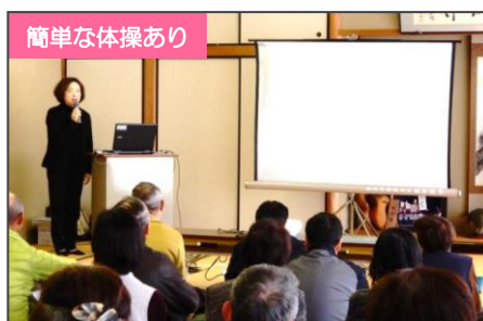
簡単な体操あり 生き生きと暮らしつづけるために いまから始めるリハビリ