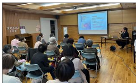
夜間頻尿 ～原因と対策について～