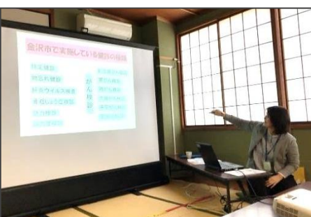
健診結果の見方について