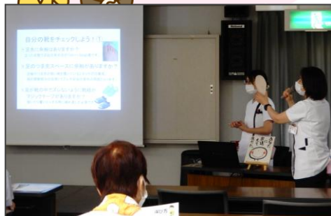
家庭でできるフットケア