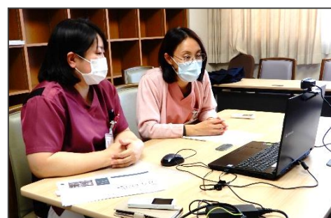
入退院支援 医療と連携