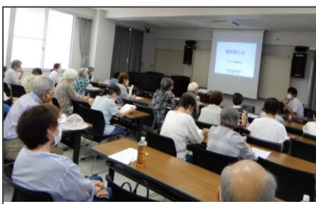
糖尿病とは 守ろう！健康寿命