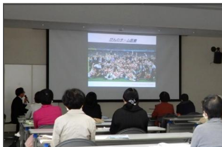
がんの予防と早期発見・ 早期治療のために