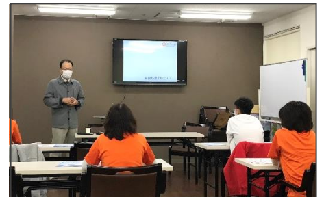
知っておきたい薬の知識