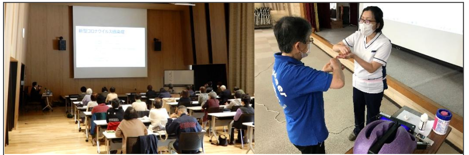
感染対策で新しい生活様式を/ 新型コロナウイルスとワクチンについて