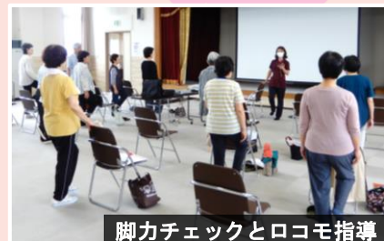
脚力チェックとロコモ指導