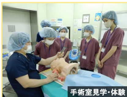
手術室見学・体験