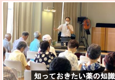
知っておきたい薬の知識