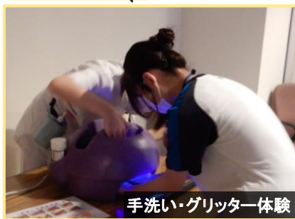
手洗い・グリッター体験