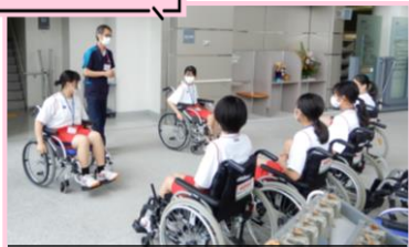
リハビリテーション部で車いす体験