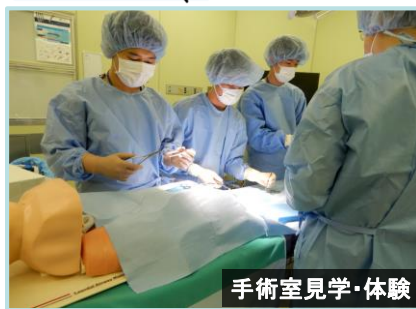
手術室見学・体験