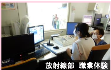
放射線部 職業体験