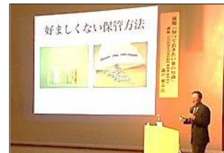
知っておきたい薬の知識 薬剤師 森戸 敏志