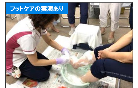
フットケアの実演あり おうちでできるフットケア フットケアチーム