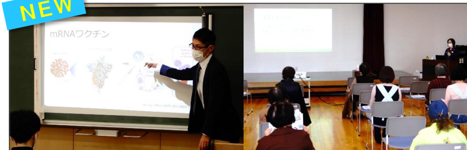
NEW 感染対策で新しい生活様式を/ 新型コロナウイルスとワクチンについて 感染対策チーム