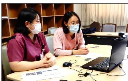
入退院支援 医療と連携 入退院支援室・ソーシャルワーカー