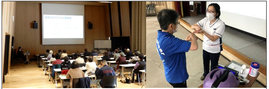
感染対策で新しい生活様式を/ 新型コロナウイルスとワクチンについて