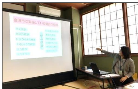
健診結果の見方について 保健師 辰村 弥生