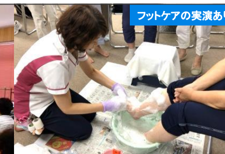
「転ばぬ先の足のケア」～おうちでできるフットケア～ フットケアチーム