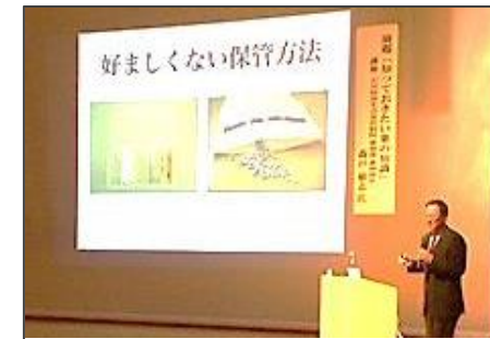
知っておきたい薬の知識 薬剤師 森戸 敏志