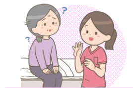
ソーシャルワーカー