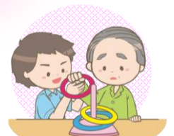
リハビリスタッフ